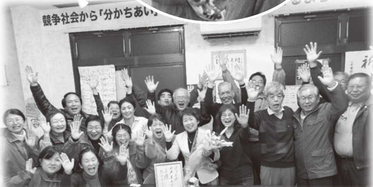
やったー！バンザーイ！