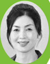
県議会議員 山本友子