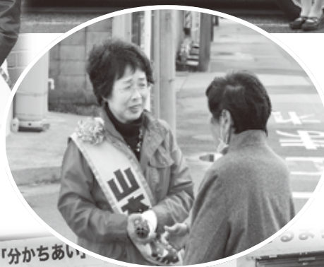
「しっかりとお願いしましたね。」と相談を受けました