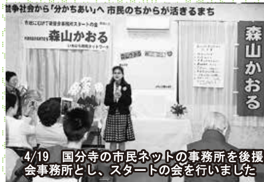
4/19 国分寺の市民ネットの事務所を後援会事務所とし、スタートの会を行いました