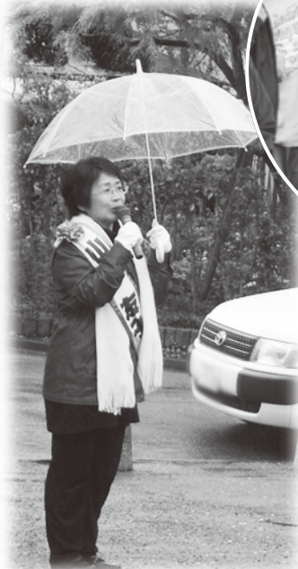
雨が降ったり、小雪が散らついたり