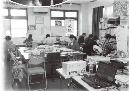
事務所ではたくさんのボランティアの方が電話をかけた、事務作業をしたりとワイワイがやがや