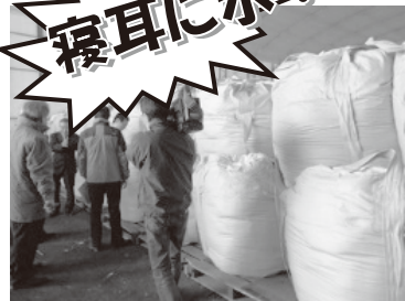
放射性廃棄物となった焼却灰のフレコンバックが運び込まれることになる

4月17日、突然、環境省が千葉県内の指定廃棄物最終処分場について、千葉市中央区にある東京電力千葉火力発電所の敷地を候補地とすると発表しました。まさに「寝耳に水」の事態！県議選、千葉市議選が終わったばかりのタイミング！（争点になることを避けた）。