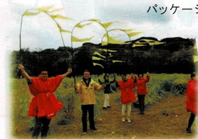
2014年のアート×ミックス 菜の花が咲く石神の風景。 レトロな小湊鉄道の車内と車窓から 見える里山の風景が劇場となる珍 しいお芝居に議員有志が出演…。