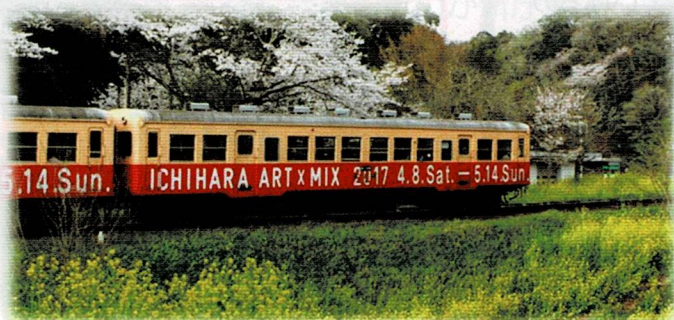
2017年のアート×ミックス パッケージされた小湊鉄道